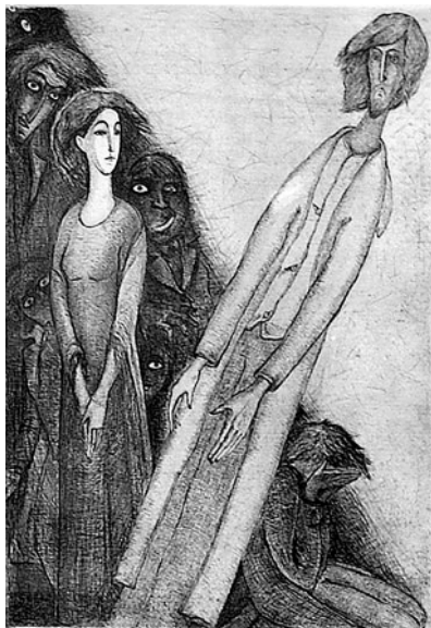
К роману «Идиот».

тяжело жить. Мой главный герой – Ставрогин Мне кажется, главной его проблемой является просто неспособность любить! Он в этом не виноват, он таким родился – никогда и никого не любил! Он абсолютно пустой, пытаюсь себя чем-нибудь заполнить, он терпит поражение! Его жалко, ему хуже всего, в конце он это понимает! Другое дело люди, окружающие его! Они чувствуют его пустоту и наполняют её чем хотят! Они видят в нём то, что им хочется! Он как зеркало, которое отражает их желания, надежды, мечты! Мой нелюбимый герой – Кириллов. Я считаю его антиподом моему любимому герою Шатову! Шатов не верил, но нашёл в себе силы признать существование Бога, а Кириллов очень сильно верил и не смог признать, я считаю это слабостью! Слабостью личности! Возникла мысль, что Шатов и Кириллов один герой, но который во время лежания в Америке получил раздвоение личности! А как же было бы правильно, если бы Шатов пришёл к выводам Кириллова, а Кириллов пришёл к выводам Шатова! Им обоим стало бы жить легче! Но... И отдельно – Верховенские. Отец и сын очень похожи! Оба – эгоисты, делающие всё только ради себя и своих амбиций, при этом любящие комфорт и готовые пожертвовать всеми ради себя! Только себя... себя... себя... Прикрываются высоким!