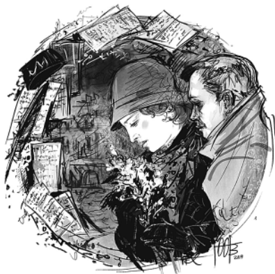
Мастер и Маргарита. Худ. Осипова

Любви не было и быть не могло, была страсть, притяжение, что угодно, но не любовь.