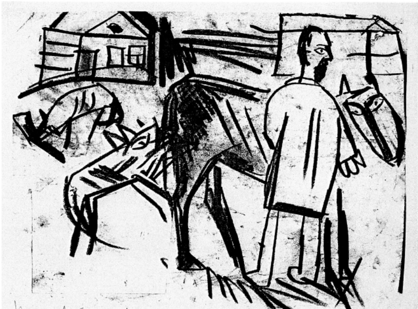
Худ. Кирилл Соколов. Иллюстрации к роману А. Платонова «Котлован»