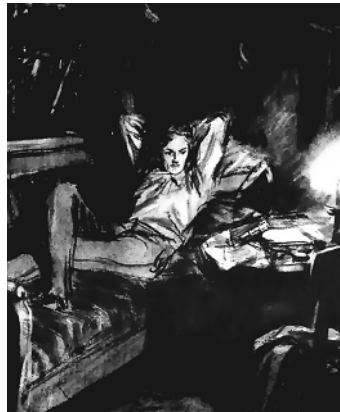
Печорин на диване. Худ. Д. Шмаринов

Участницы разговора тоже трезво оценивают ситуацию и дают советы. Предостерегают. С юмором: «Не связывайтесь, будете для него Карагёзом». Или серьёзно: «Была я влюблена в такого сильно. Ничем хорошим не кончилось... Автор, не надо, найдите попроще, а этого любите на расстоянии. С таким Вы семью вряд ли постройте». Предполагают: «Как только Вы с крючка его выскользнете, ему, этому Печорину, будет обидно – как такого красавца и разлюбили.