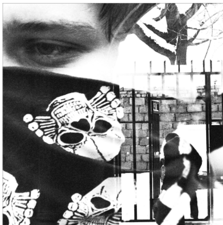
«Молчание». Загружено пользователями сети как иллюстрация к роману «Санька»

жалостливая вставка про этот «никнейм», кстати) симпатии не вызывает. Хрен с ним, что он не хочет работать, учиться, развивать мозги и так далее. Но нафига ему забираться в политические дебри? Или это Прилепин так ловко показывает, что тупыми баранами а-ля Санька легко управлять? Ведь своих политических взглядов у главного героя нет, только чужие, навязанные теми, кто ведёт баранчиков на убой. В таком случае нечего добрую половину текста отстаивать право гопника на глубокую душу – может, она у кого-то из них и действительно есть, но не про Санькину честь.