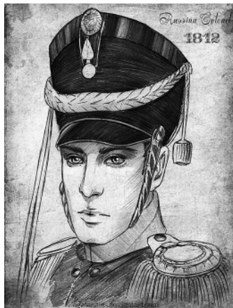
Князь Болконский. Худ. AngelaNarish

Мне кажется, в Соне автор хотел отразить женскую позицию, когда человек поступает «хорошо» по уму, а не по сердцу и не умеет любить, не раскрыл свою душу. Все проявления, в том числе «добродетельные», – пресны, потому и вызывают «слишком слабую благодарность». Это как улыбка торгового представителя или генетически модифицированный картофель... Позиция автора состоит в том, что человек, слушающий голос своей души,