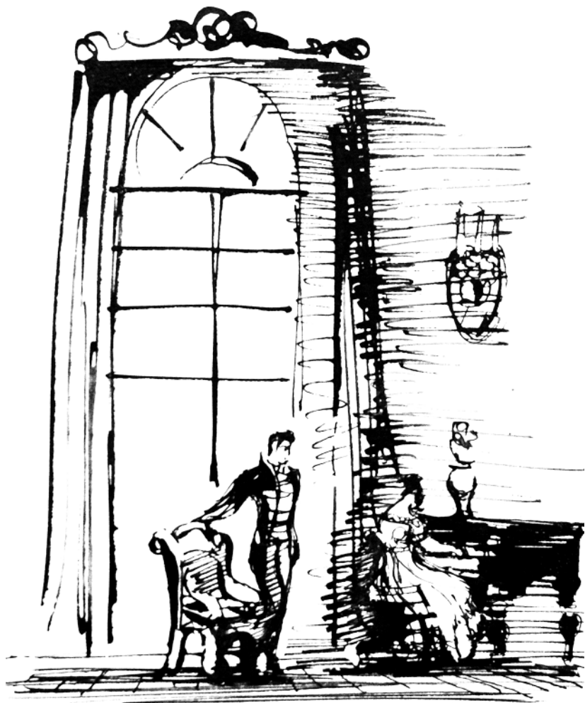
Маша и Дефорж. Иосиф Ец. Илл. к повести «Дубровский». 1938 г.