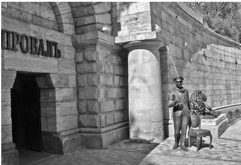
Пятигорск. Памятник Остапу Бендеру Скульптор Равиль Юсупов. 2008 г.

ветствии с меняющейся «линией партии» и политической конъюнктурой называть авторов глубоко советскими или антисоветскими, осуждать или награждать, останавливать в печати или издавать огромными тиражами – романы неизменно пользовались популярностью у читателей.