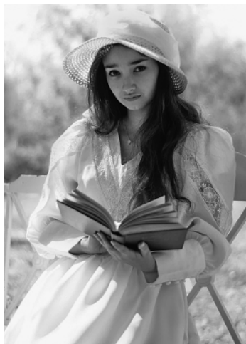
«Ася». Илл. к повести Тургенева. Худ. Д. Б. Боровский. «Тургеневская девушка». Жанровый портрет. 2013 г.

как-то относиться? Он же был героем “ихнего” времени, а сейчас время не героическое, да и герои давно не в моде». Во всех остальных случаях речь шла именно о сегодняшнем дне, сегодняшних чувствах и сегодняшних драмах.