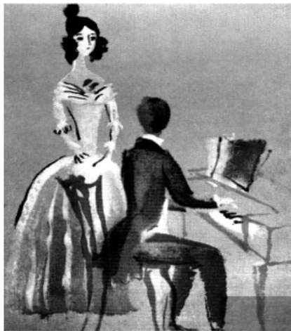
Маша и Дефорж. Художники Г. А. В. Траугот

Почти все крупные произведения Пушкина начинаются интересно, иногда довольно интересно развиваются, но заканчиваются абсолютно невнятно. А чаще вообще никак не заканчиваются (пожалуй, исключением является «Пиковая дама», но исключение, как известно, существует для того, чтобы им проверять правило). Дубровский – типичный продукт своего времени: понача-