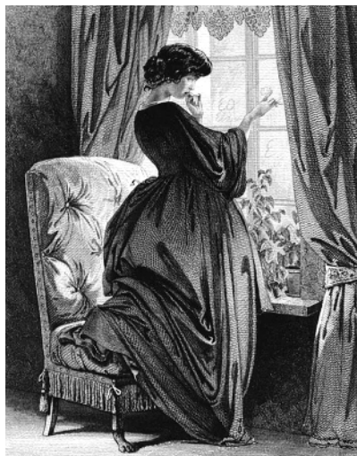
Татьяна. Худ. М. Микешин. 1862 г.

Мне казалось, что героиня Толстого очень похожа на Татьяну Ларину. Но, когда читаешь критику, оторопь берет! Татьяна – идеал, цельная, верная, благородная натура и т. д. А Соню за то же самое пинают – скучная, бескрылая, правильная, ах, как это банально – всю жизнь любить одного человека! Зато Наташа (вылитая Ольга, между прочим) у нас ангел без крылышек! Несправедливо. Я очень люблю Таню. И Соню. И считаю, Лев Николаевич её обидел. А следом за ним – и критики.