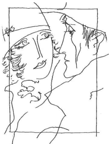
Маргарита и Мастер. Худ. Б. Маркевич

В горячих дискуссиях о Маргарите на одной стороне – те, кто называет её истинной любящей женщиной, готовой пойти на всё ради любимого.