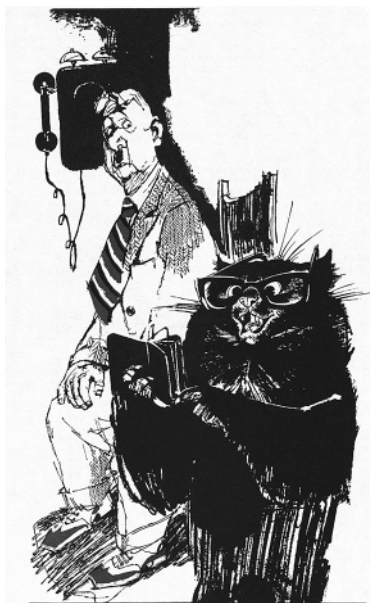
Бегемот и Стёпа Лиходеев. Худ. Г. Д. Новожилов