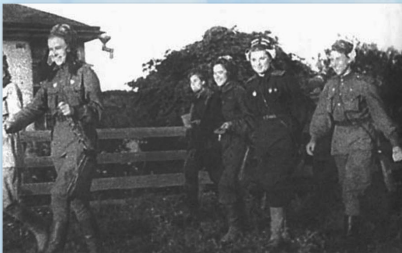
Кадр из документального фильма. Экипажи идут на построение. Станица Ивановская. 1943 год.

В Пашковской наш полк разместился на большом аэродроме. Здесь царил разруха. По краям поля сохранились лишь глубокие капониры, где мы прятали свои самолеты от воздушных разведчиков противника.